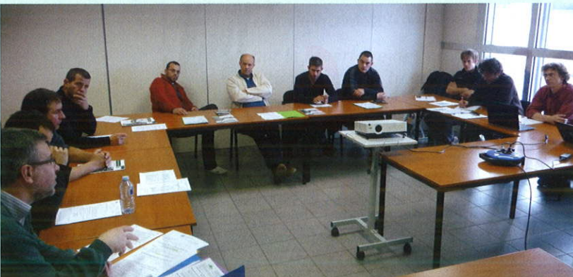
Le groupe de travail FNEDT sur le débardage par câble aérien s'est réuni le 10 janvier à la CCI de Villefontaine (Isère).

Les entrepreneurs, dans leurs échanges, ont particulièrement souligné les points suivants : le manque de chantiers proposés par l'ONF et les communes forestières, la concurrence des entreprises européennes, la formation des salariés, la baisse